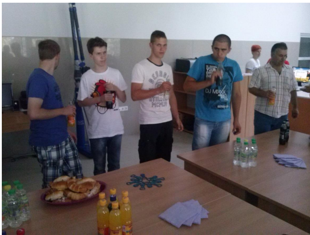
doček firma PIB-Extra-d.o.o.