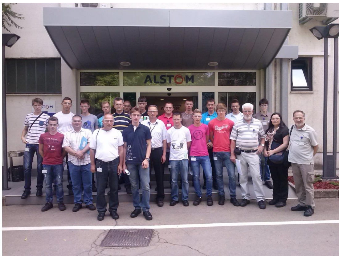
posjet firmi Alstom